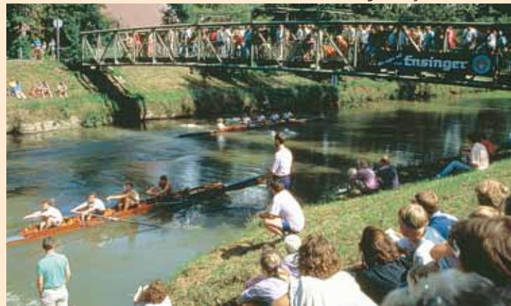
Ruderregatta auf der Rems

Die große Erleninsel – und über eine Fußgängerbrücke verbunden die kleine Erleninsel – ist die grüne Lunge der Stadt. Zahlreiche Freizeiteinrichtungen, vom Minigolfplatz über Spielplätze bis zum Sporthallenbad, sind hier gebündelt. Auch Rudern ist eine beliebte Sportart.