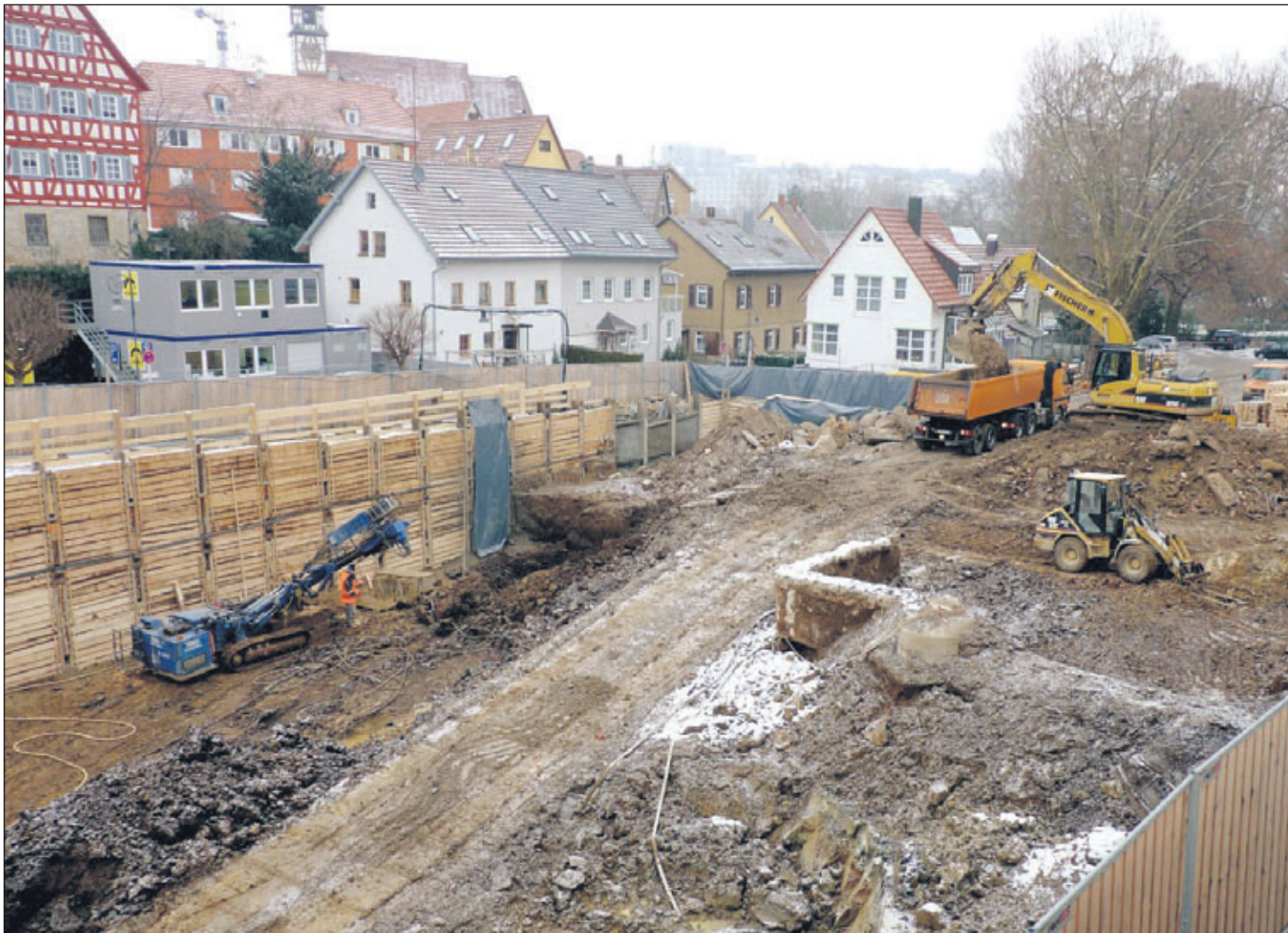
Ein Blick hinter den Bauzaun: die Tiefbauarbeiten für den zweiten Bauabschnitt des Postplatz-Forums liegen im Zeitplan.

Der nächste Warentauschtag am Samstag, 6. Februar 2010, wird wieder in der Rundsporthalle veranstaltet. Unter dem Motto „Tauschen statt wegwerfen“ will die Stadtverwaltung gemeinsam mit dem Bund für Umwelt- und Naturschutz zur Müllvermeidung anregen. Von 9 Uhr bis 11 Uhr können gut erhaltene Gegenstände angeliefert werden, wobei sperrige Dinge aus Platzgründen nicht mitgebracht werden dürfen. Diese können am „Schwarzen Brett“ ausgeschrieben werden. Die mitgebrachten und tatsächlich wiederverwendbaren sowie hygienisch einwandfreien Gebrauchsgegenstände wie Bücher, CDs, Haushaltswaren, Spielsachen, Kinder- und Erwachsenen-Kleidung werden sortiert auf Tischen ausgestellt. Von 9 Uhr bis 12 Uhr kann jeder „zum Nulltarif“ von den Tischen das mitnehmen, was er gebrauchen kann. Sondermüll wie Reifen, aber auch defekte Elektrogeräte können nicht angenommen werden, ebenso wie Ski, Schuhe und Federbetten oder Kinderwagen. Offensichtlich nicht Verwertbares muss zurückgewiesen werden. Angelieferte Waren dürfen jedoch nicht einfach auf dem Parkplatz deponiert werden. Getauscht wird in der Halle. Fragen zum Waren-Tauschtag beantwortet die Abteilung Umwelt der Stadt unter ☎ 07151 5001-445 oder -244.