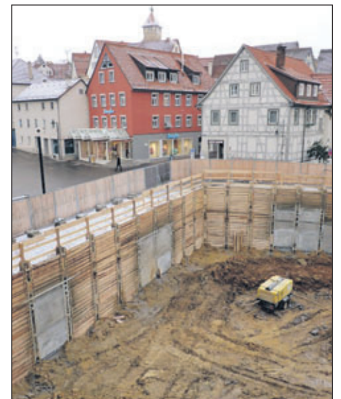
Zweigeschossig wird auch die zusätzliche Tiefgarage, die an die bisherige Postplatz-Garage angebunden wird.