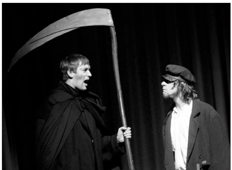
Die Kommunale Bühne Waiblingen zeigt den „Fuhrmann“, aufgeführt vom Ensemble „LiteraVox“, am Freitag, 5. Februar 2010, um 19 Uhr im Bürgerzentrum. Der Eintritt ist frei.

Die Entscheidung für dieses Stück fiel, weil das Ensemble Selma Lagerlöf zu ihrem 150. Geburtstag gratulieren möchte. Zur Aufführung kommt es jetzt pünktlich zu einem weiteren Gedenktag: Vor 100 Jahren (1909) wurde Selma Lagerlöf der Nobelpreis für Literatur für ihr Werk „Nils Holgersson“ verliehen – als erste Frau überhaupt. Weitere Informationen zum Ensemble auch unter www.LiteraVox.de .