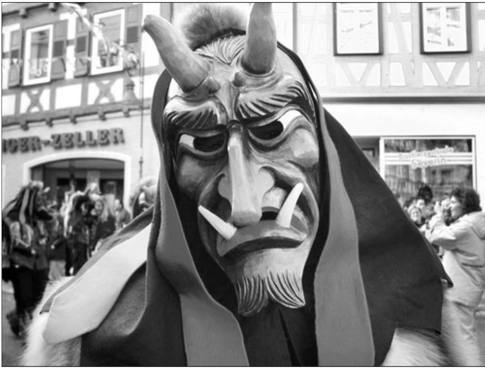
In Waiblingen wird's ernst: Die Narren sind demnächst wieder los!