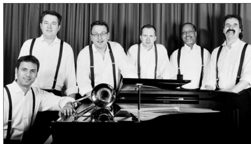
Zur Dixieland-Party mit „Joe Wulf and the Gentlemen of Swing“ lädt die Abteilung Kultur der Stadt Waiblingen am Freitag, 12. Februar 2010, um 20 Uhr in der Reihe „Jazz im Studio“ ins WN-Studio des Bürgerzentrums ein.

Karten gibt es im Vorverkauf bei folgenden Einrichtungen: Touristinformation Waiblingen (i-Punkt), Scheuerngasse 4, ☎ 07151 5001-155, Fax 07151 5001-137, E-Mail touristinfo@waiblingen.de ; Buchhandlung Hess im Marktdreieck, Kurze Straße 24, ☎ 07151 1718-115; Internet unter www.ticketonline.de . Auskunfts gibt die Stadt Waiblingen, Abteilung Kultur, ☎ 07151 2001-10, E-Mail anaboero@waiblingen.de .