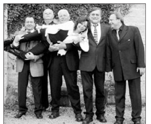
Mit „Tante Friedas Jazzkränzchen“ am Freitag, 3. Dezember 2010, um 20 Uhr geht die Reihe „Jazz im Studio“ im Bürgerzentrum zu Ende.

„Tante Friedas Jazzkränzchen“ aus Reutlingen spielt am Freitag, 3. Dezember 2010, um 20 Uhr im WN-Studio des Bürgerzentrums. Damit geht die Reihe „Jazz im Studio“ zu Ende. „Tante Friedas Jazzkränzchen“ ist die wohl bekannteste und renommierteste Dixieland-Band im ganzen Kreis Reutlingen und weit über die Kreisgrenzen hinaus bekannt. Kein Wunder, schließlich existiert die Band schon seit mehr als 40 Jahren und kann auf eine Vielzahl erfolgreicher Auftritte und Konzerte im In- und Ausland verweisen, sei es in Jazzclubs, auf Festivals oder vielen anderen Gelegenheiten. Präsentiert wird Oldtime-Jazz der Jahre 1910 bis