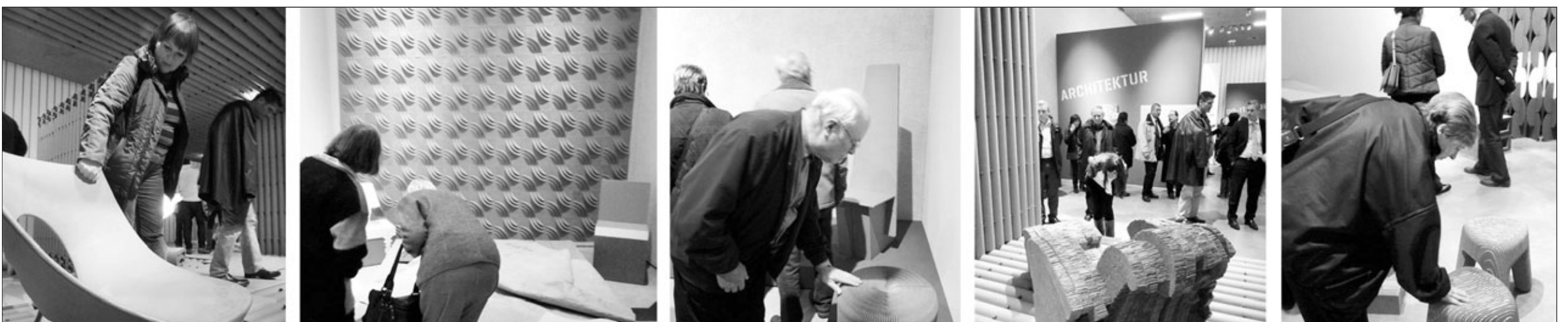
Karton – Pappmaché – Papier? Kaum zu glauben, war so mancher Mimik zu entnehmen: das Vernissagenpublikum in der Galerie Stihl Waiblingen zeigte sich am Donnerstag, 25. November 2010, beeindruckt. Die neuste Ausstellung „Einrichten. Leben in Karton“ ist noch bis 27. Februar nächsten Jahres zu sehen.

Die Zufahrt in die Badstraße muss wegen der dortigen Arbeiten gesperrt werden. Anwohner der Badstraße sowie Berufspendler der Firma Stihl Werk 1 werden gebeten, dann die Umleitung über den Rank in Neustadt zu nutzen.