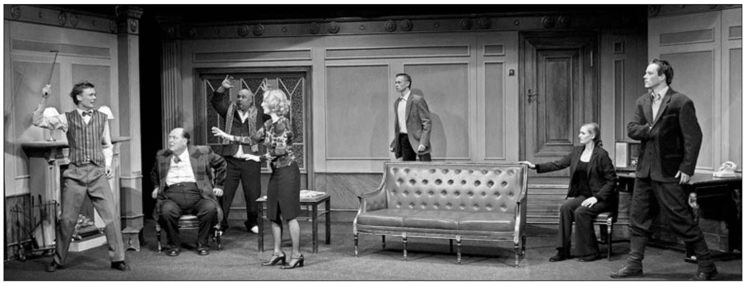
Der Klassiker unter den Kriminalstücken: „Die Mausefalle“ wird am Dienstag, 14. Dezember 2010, um 20 Uhr vom Berliner Kriminaltheater im Waiblinger Bürgerzentrum aufgeführt.