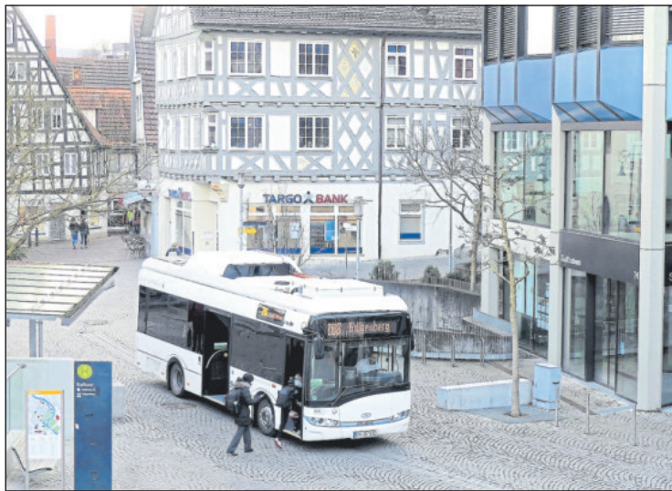
Die neuen E-Busse der Linien 208 und 218 schnurren emissionsfrei und geräuscharm durch die Innenstadt – auch an Markttagen.