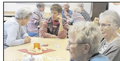
Sonntags-Café im vollen Betrieb (Foto: Schütze)

Auch wenn die meisten Vorbereitungen noch hinter den Kulissen verlaufen, deutet die hohe Zahl an Projektgruppentreffen auf die vielen Pläne hin, die momentan geschmiedet werden. Ausführlicher werden die Projektgruppen am 16. März beim Austauschtreffen von ihren Plänen berichten (s. unten). Zur Übersicht