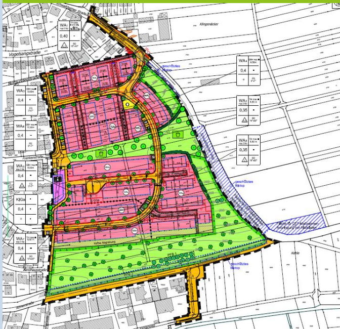
Bebauungsplan Berg-Bürg II